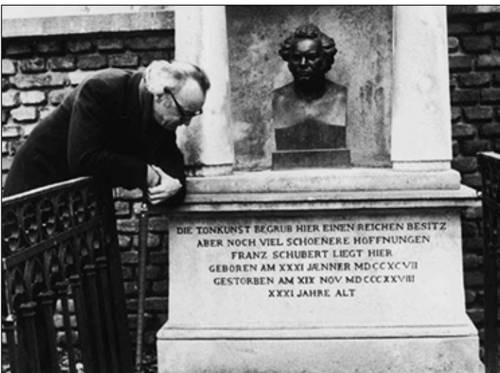
De pianist Alfred Brendel bij het graf met opschrift

Schubert was toortsdrager op de begrafenis van Beethoven (waar tussen haakjes 20.000 man aanwezig was!). Na de begrafenis ging hij met vrienden naar het café en de eerste dronk toastte hij “op hem die we juist begraven hebben”; daarna toastte hij “op hem die de volgende zal zijn”. Twintig maanden later zou Schubert sterven. Het was zijn wens om naast Beethoven begraven te worden. Dat is dan ook gebeurd. De bekende Oostenrijkse dichter en vriend van Schubert, Grillparzer, maakte het grafschrift: “De dood begroef hier een rijk bezit, doch nog schoner verwachtingen.”