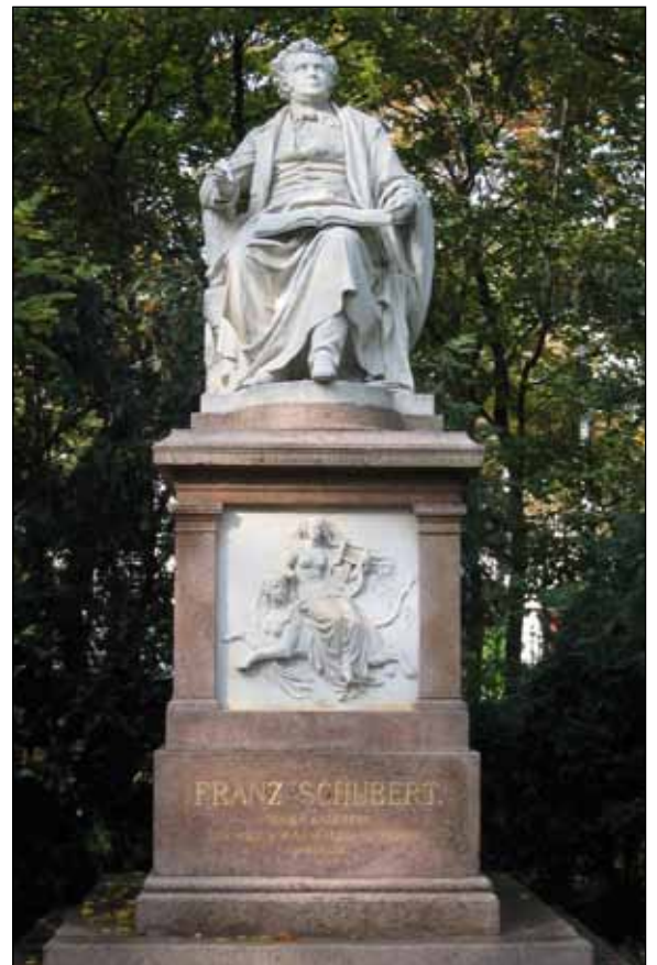
Monument in het stadspark van Wenen