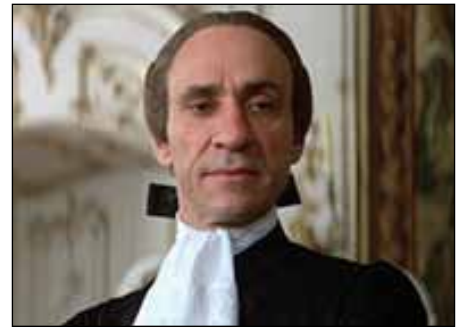
Salieri in de film Amadeus

Zonder vaste betrekking kon hij zijn trouwplannen met zijn jeugdvriendin wel vergeten.