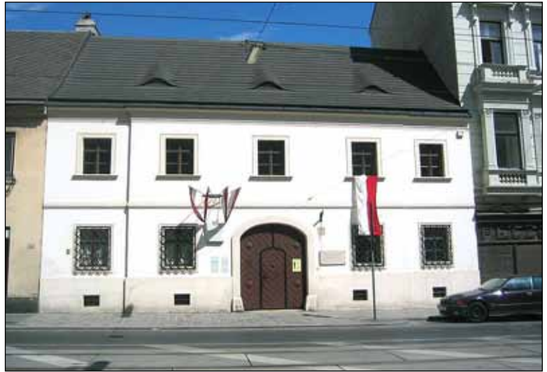
Geboortehuis van Franz Schubert (vroeger en nu)